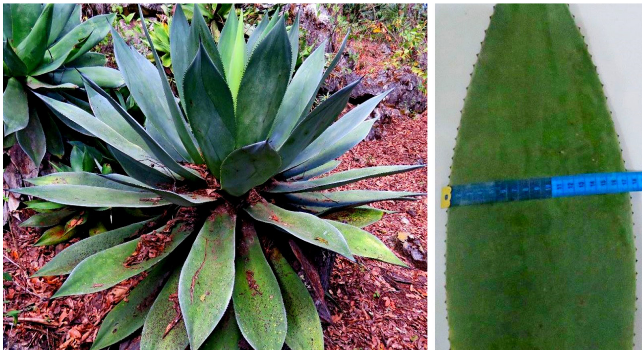
Figura 2. Agave chiapensis , nombre común: maguey chamula, localizado cerca del ejido Rancho Nuevo en los alrededores del municipio de San Cristóbal de las Casas.

El Agave chiapensis es una variedad endémica del estado de Chiapas en los alrededores del municipio de San Cristóbal de las Casas; cercanos al ejido Rancho Nuevo (Figura 2). Esta variedad se caracteriza por crecer en áreas frías y cercanas a cerros. Las comunidades indígenas realizan la propagación de dicha variedad mediante hijuelos y los trasplantan en zonas con terreno más plano para tener fácil acceso a ellos. Tienen la tradición desde hace más de 30 años que por cada nacimiento de un integrante de la comunidad ejidal deben trasplantar un hijuelo. El Agave chiapensis es utilizado para el desarrollo de una bebida fermentada tipo pulque, como planta de ornato, para elaboración de fibras y como barrera para proteger sus terrenos. Las plantas muestreadas se encontraron en Los Altos, en el ejido de Rancho Nuevo, municipio de San Cristóbal de las Casas, Chiapas.