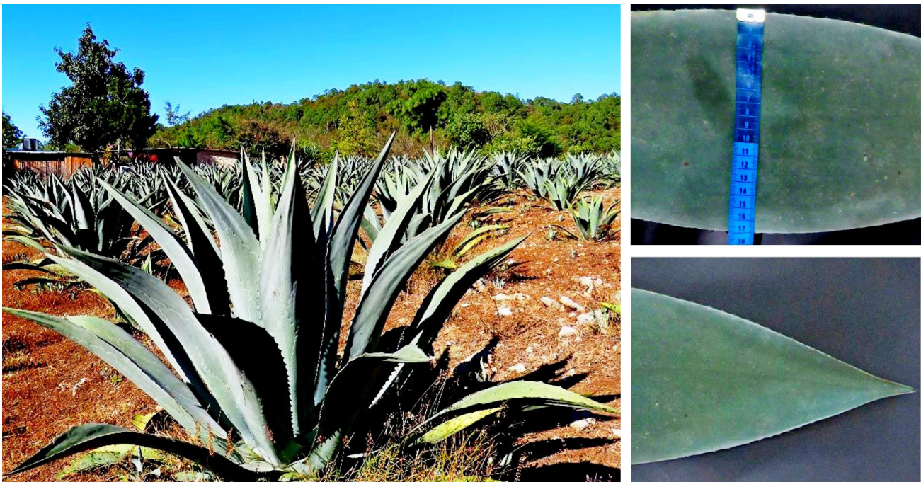
Figura 1. Agave americana , nombre común: maguey comiteco azul, localizado en la región de la meseta comiteca, ubicada a la salida del municipio de Comitán de Domínguez.

El Agave americana es un maguey conocido comercialmente en el estado de Chiapas como comiteco (Figura 1), su uso está ligado a la elaboración de bebidas como aguamiel, pulque y la elaboración de licor denominado “comiteco”. El cultivo es extenso, sin embargo, se encuentra disperso entre diferentes municipios. La propagación de maguey comiteco se realiza por hijuelos por parte de los productores de la localidad de Comitán de Domínguez, de ahí su nombre común. El uso de este maguey se remonta al año 1910 y hoy en día su cultivo es de importancia en el estado de Chiapas, sobre todo para la producción de “comiteco”, el cual es una bebida obtenida de la fermentación y posterior destilación del aguamiel (savia obtenida del raspado del maguey). Los municipios productores de maguey comiteco son Comitán de Domínguez, Amatenango del Valle y Las Rosas.