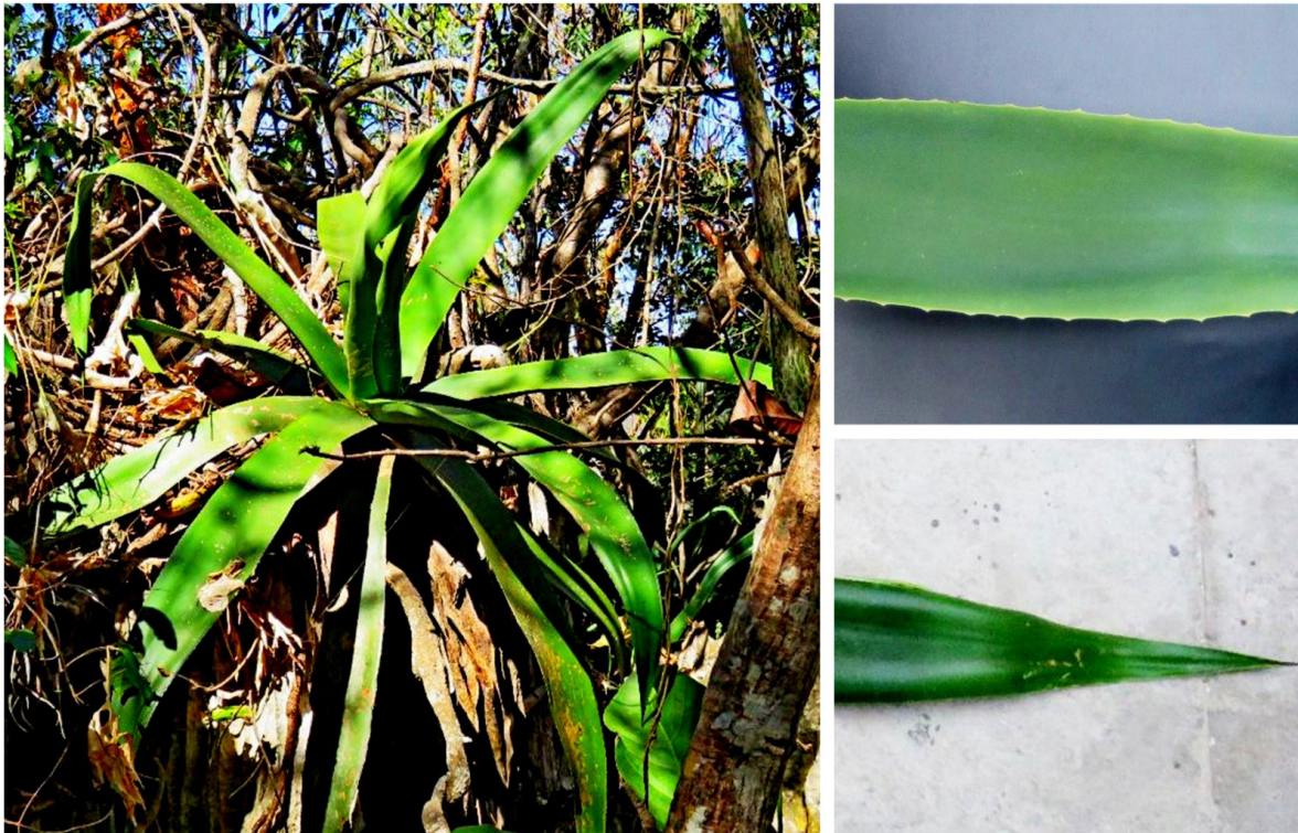
Figura 3. Agave grijalvensis , nombre común: maguey grijalva, localizado en el mirador Las Manos que imploran, en el municipio de San Fernando, Chiapas.

En las regiones aledañas a los sitios con la presencia de magueyes se encuentran presentes habitantes de comunidades indígenas y ejidos; cuyas actividades principales son pastoreo y cultivos, así como la venta de artesanías hechas por ellos mismos. Los magueyes son considerados reliquias de las regiones debido a que permiten la generación de bebidas espirituosas tradicionales como el comiteco, donde se aprovecha sólo la savia de la planta. La transformación de las pencas en productos de mayor valor agregado, aprovechando la presencia de azúcares, fructanos y compuestos bioactivos podría permitir generar una nueva fuente de ingresos para dichas comunidades.